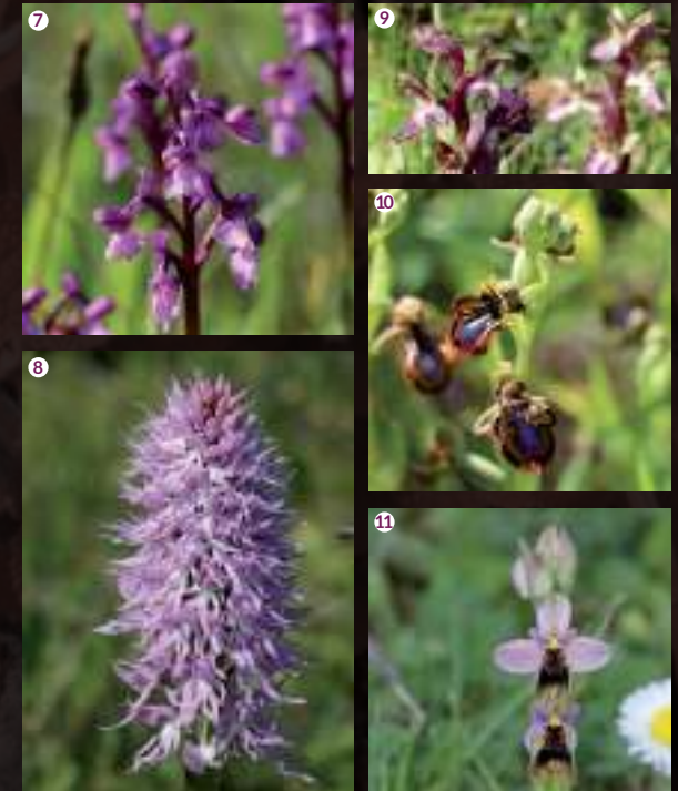
7. Orchis morio sb picta • 8. Orchis italica • 9. Orchis collina 10. Ophrys speculum • 11. Ophrys tenthredinifera

La mayoría de nuestras orquídeas están protegidas por la ley y su colecta o daño está penado.